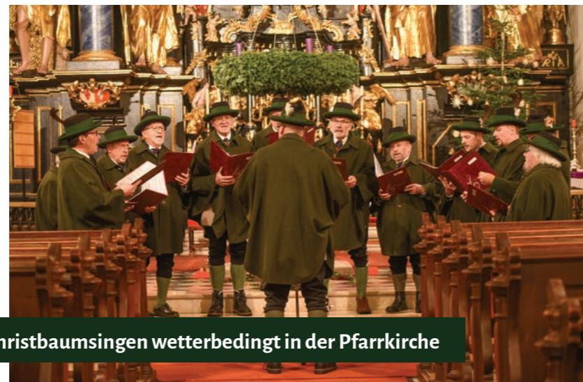
Christbaumsingen wetterbedingt in der Pfarrkirche