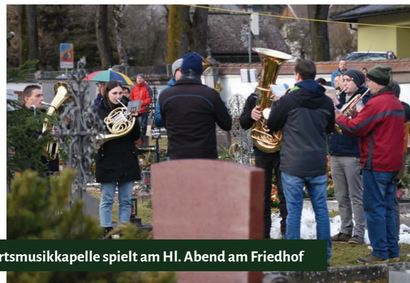
Ortsmusikkapelle spielt am Hl. Abend am Friedhof