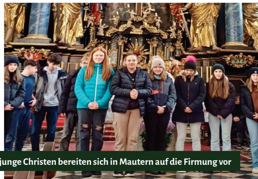
9 junge Christen bereiten sich in Mautern auf die Firmung vor