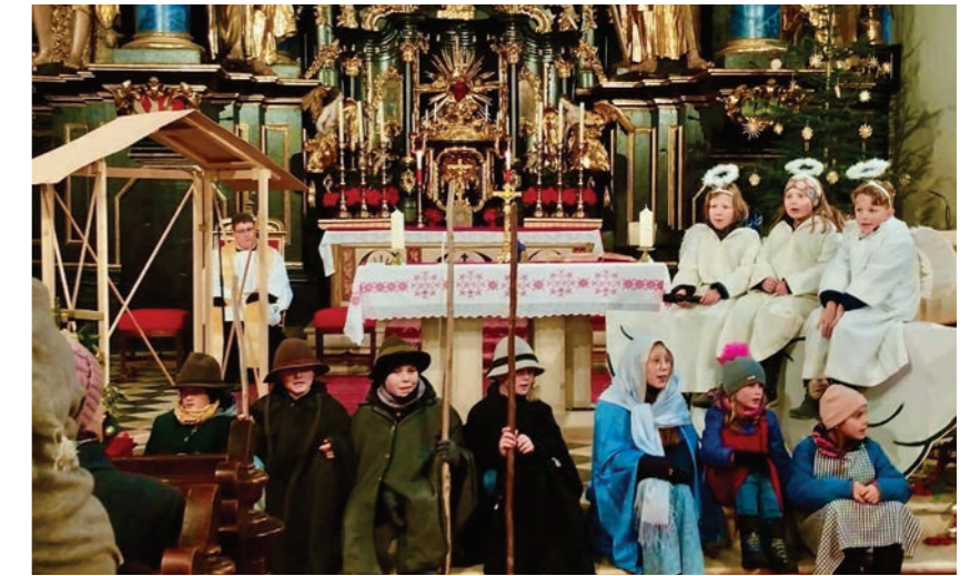
Kinderkrippenfeier am Heiligen Abend

Am Nachmittag des 24. Dezember versammelten sich viele junge Familien mit ihren Kindern in der Pfarrkirche, um in einem kleinen Gottesdienst