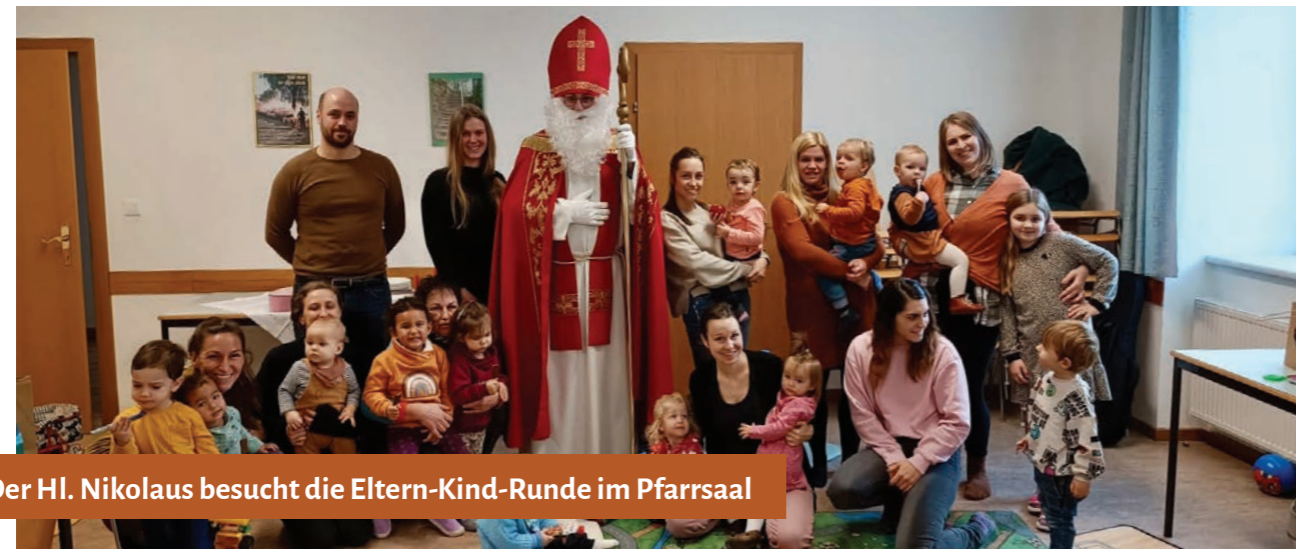
Der Hl. Nikolaus besucht die Eltern-Kind-Runde im Pfarrsaal