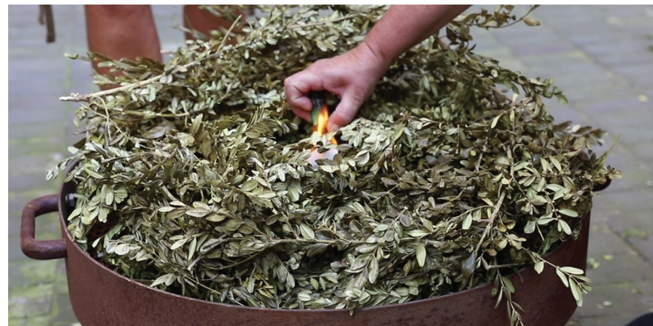
Aus den Palmzweigen des Vorjahres wird die Asche für den Aschermittwoch bereitet.

Die sieben Sakramente wurden von Jesus Christus eingesetzt, die Sakramentalien von der Kirche. Sakramente wirken „kraft ihres Vollzuges“, der Segen der Sakramentalien beruht auf der Grundlage des Weihegebets der Kirche und dem Glauben und Vertrauen des einzelnen Christen, des Spenders und des Empfängers.