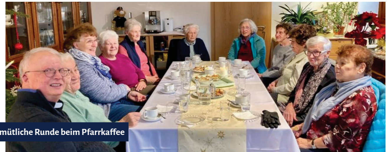
Gemütliche Runde beim Pfarrkaffee