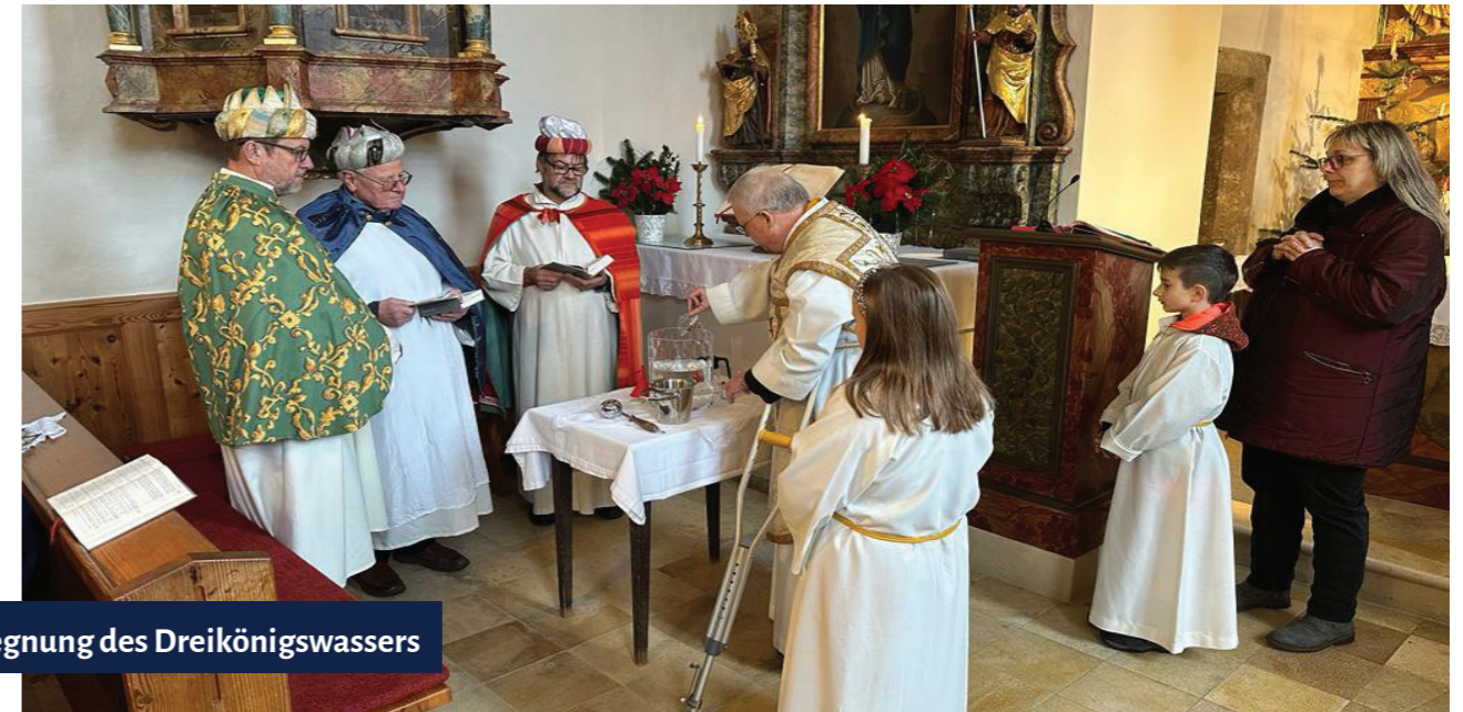
Segnung des Dreikönigswassers