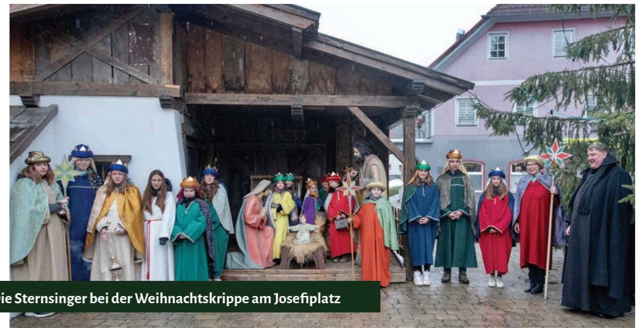
Die Sternsinger bei der Weihnachtskrippe am Josefiplatz

die Geburt Jesu zu feiern. Höhepunkt war wie immer das Krippenspiel. Am Ende des Gottesdienstes durfte jedes Kind dem Jesuskind in der Krippe ein Geburtstagsgeschenk in Form eines Weihrauchkörnerls schenken.