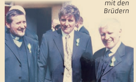
mit den Brüdern