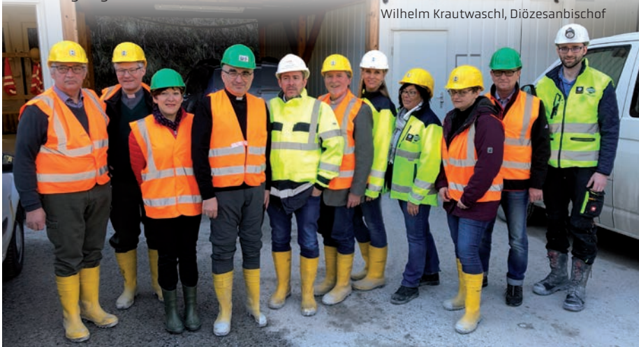
Besichtigung der Tunnelbaustelle