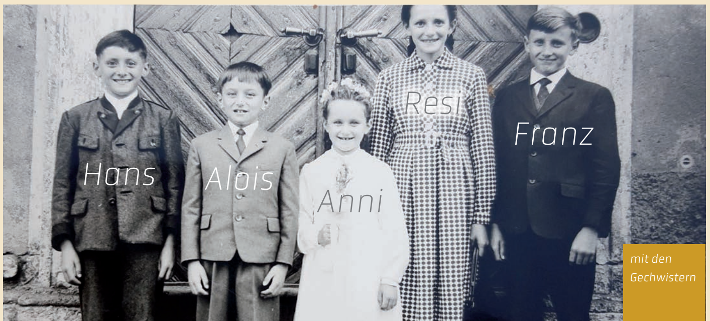
mit den Geschwistern