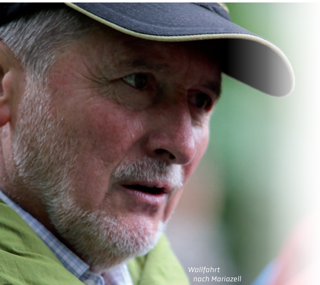
Wallfahrt nach Mariazell