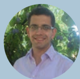
Ökumenischer Gottesdienst mit Bischof Herwig Sturm