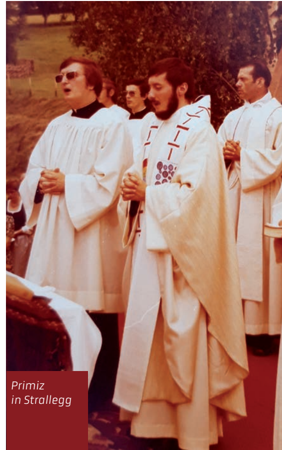
Primiz in Strallegg