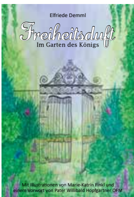
Mit Illustrationen von Marie-Katrin Finkl und einem Vorwort von Pater Willibald Hopfgartner OFM