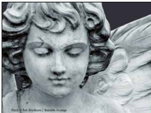
Beautiful Anzeige