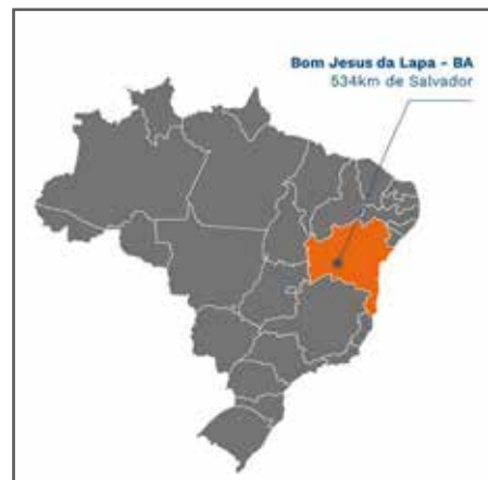
Bom Jesus da Lapa liegt im Bundesstaat Bahia in Brasilien