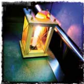
Das Friedenslicht ist ab 09.00 Uhr in beiden Pfarrkirchen erhältlich.