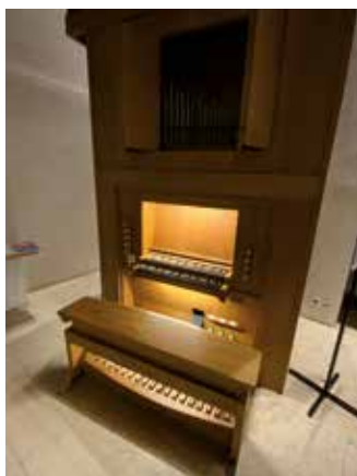
Der Schweller im Brustwerk wurde wieder instandgesetzt und das Notenpult neu gestaltet.

Den neuen Klang wollen wir Ihnen natürlich nicht vorenthalten: Rund um die Orgelweihe am Christkönigssonntag haben wir einige Konzerte geplant (siehe