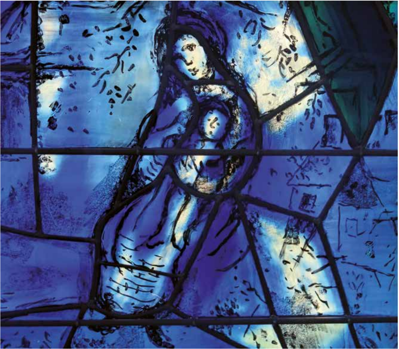
Friedensfenster von Marc Chagall in Sarrebourg, Elsass (1976) Ausschnitt, Foto Kurt Zisler