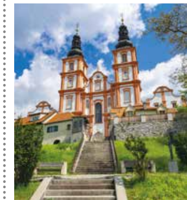
Auch nach dem „Tag des Denkmals“ (25. September 2022) können Sie die Basilika Mariatrost jederzeit besuchen.

Infos zur Basilika als „Denkmal des Monats“: www.bda.gv.at/service/denkmal-des-monats/2022/sep-tember-2022.html