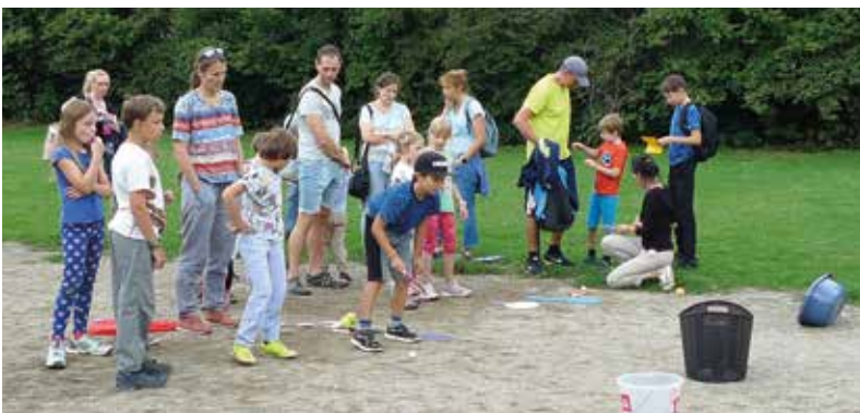
Ihr Kirche-Sport-Fest feierte eine große Kindschar heuer zum zweiten Mal am Bezirkssportplatz. Nach einem von der Familienband gestalteten Gottesdienst boten zahlreiche Stationen Kindern und Eltern Spaß und Action.