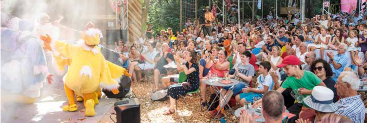
Der ZIRKUS PRATTES konnte zur Eröffnungsgala in Mariagrün mehr als 1.200 Gäste begrüßen. Den ganzen Sommer hindurch begeisterte das vielseitige Programm Woche für Woche mit Musik, Kabarett, Zauberei und Tanz.