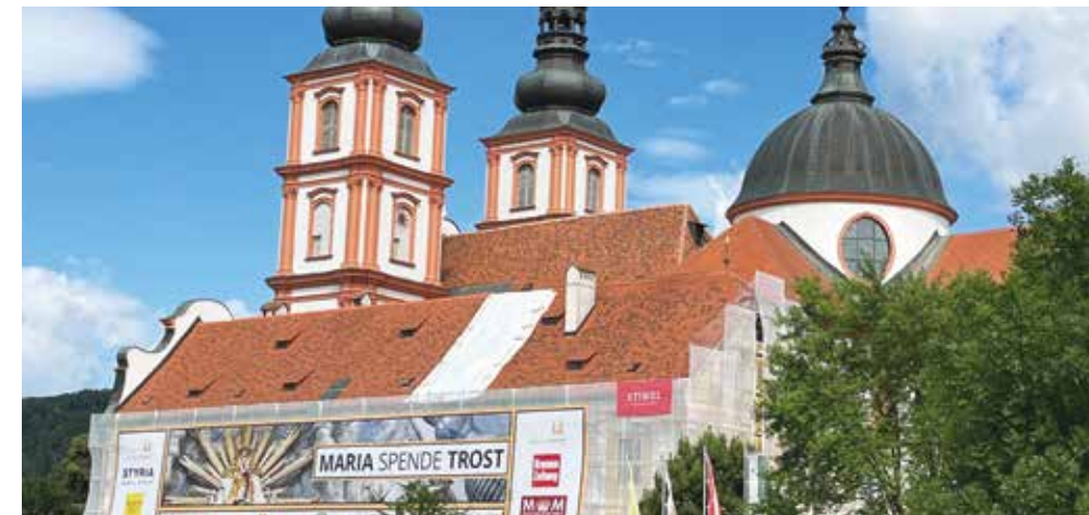
Die Basilika MARIATROST wurde vom Bundesdenkmalamt im September 2022 zum „Denkmal des Monats“ ernannt. Darüber freuen wir uns sehr.

S eit einiger Zeit ist nun auch die Fassade des „Süd- und Ost-Trakts“ der Klosteranlage von einem Baugerüst bedeckt. Man spürt: Hier will etwas weitergehen.