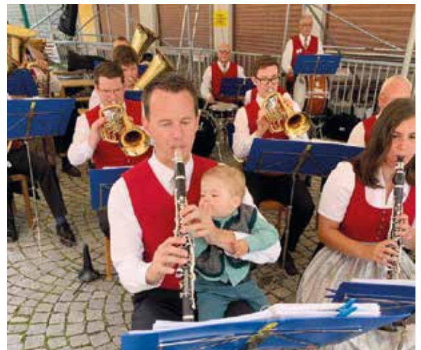
Zeit, um Kraft zu tanken: Junge Herzen erfreuen beim Mariatroster Pfarrfest eine heitere Feierguschaft.