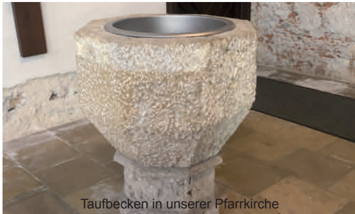
Taufbecken in unserer Pfarrkirche

„Der Herr ist mein Licht und mein Heil.“ Psalm 27,1 (Gotteslob Nr. 38)