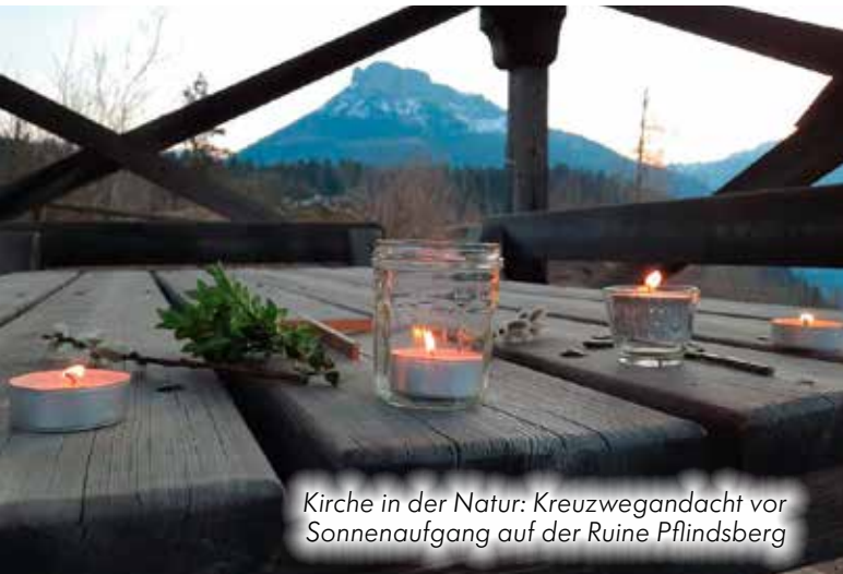
Kirche in der Natur: Kreuzwegandacht vor Sonnenaufgang auf der Ruine Pflindsberg