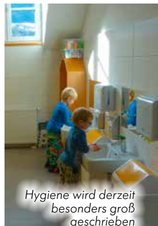
Hygiene wird derzeit besonders groß geschrieben

Das Team vom Pfarrkindergarten Grundlsee