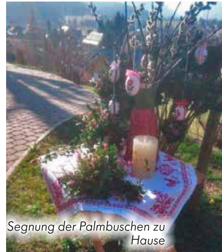
Segnung der Palmbuschen zu Hause

und das Miteinander innerhalb der Familie bewusster gefeiert wurde. Mit dieser positiven Erfahrung können wir gemeinsam, mit Vertrauen und Zuversicht, auf die Bewältigung dieser besonderen Zeit hoffen.