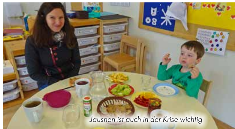
Jausnen ist auch in der Krise wichtig