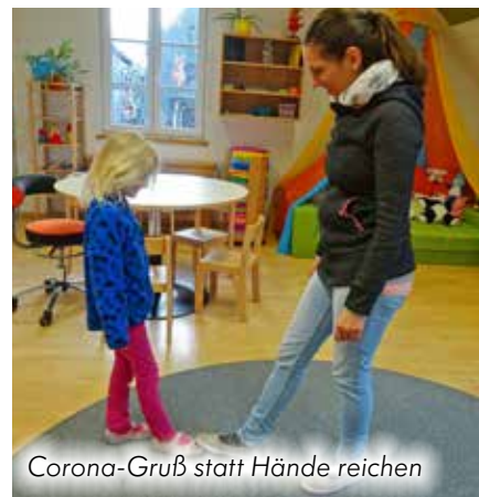
Corona-Gruß statt Hände reichen