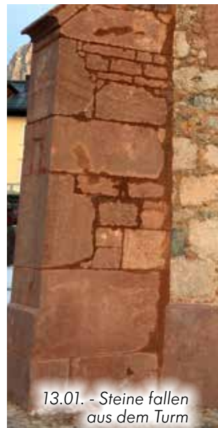
13.01. - Steine fallen aus dem Turm