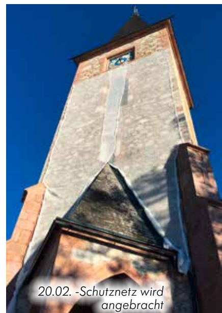
20.02. - Schutznetz wird angebracht