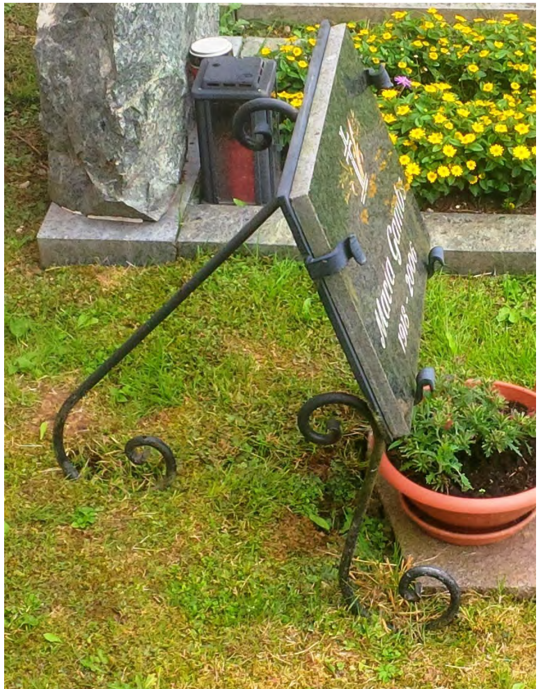
Beispiel eines Urnengrabes auf dem Friedhof Zeutschach