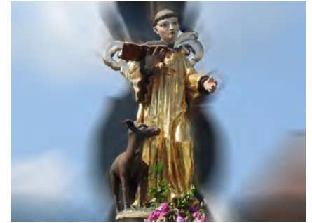
Statue des Hl. Ägidius auf Tragstange