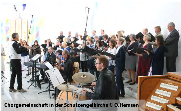
Chorgemeinschaft in der Schutzengelkirche

36 schöne Stunden mit Musik, Kultur, Natur und ganz viel Sonnenschein zwischen Steinschloss und Maria Schönanger