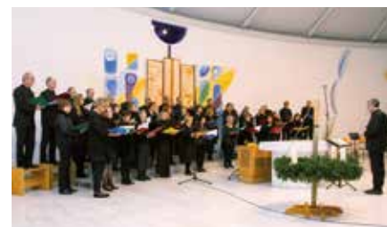
Ein stimmungsvoller Fixpunkt zu Beginn des Advents

Am 1. Adventsonntag, den 01. Dezember lädt um 18.00 Uhr die Chorgemeinschaft Schutzengel zum Adventkonzert herzlich ein.