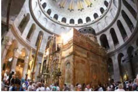
In der Grabeskirche in Jerusalem.

fahren, ist ein spannendes Unternehmen, das jedem Christen empfohlen sei. Das tägliche Morgen- und Abendgebet mit Psalmen und einer Bibelstelle förderten dieses Wahr-Nehmen.