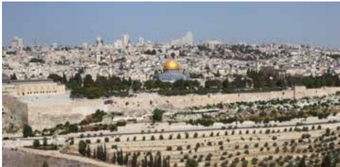
Jerusalem – das Zentrum der drei großen monotheistischen Religionen mit dem Felsendom, der Westmauer und der Grabeskirche,