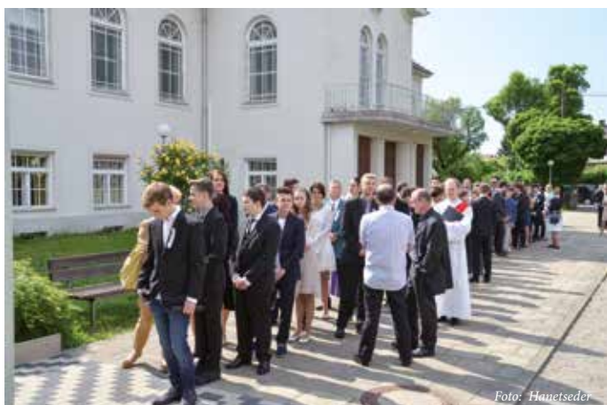
Der Höhepunkt der Firmvorbereitung – die Feier der Firmung in den beiden Pfarrkirchen Christkönig und Schutzengel.

Wenn Du 2020 das Sakrament der Firmung empfangen möchtest, bitten wir Dich, Dich bis 25. Oktober zu den Öffnungszeiten der Pfarrkanzlei anzumelden. Infoabend für die Firmvorbereitung für Firmlinge und Eltern: Dienstag, 19. November, 19.00 Uhr im Schutzengelsaal (Pfarrgasse 25, 8020). In der Vorbereitungszeit (Jänner bis Mai) geht es darum, in den Gruppenstunden, aber auch bei gemeinsamen