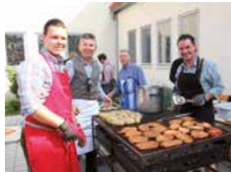
Herbstfest im Pfarrverband – heuer in Christkönig

Am Sonntag, den 29. September um 10.30 Uhr feiern wir Erntedank mit anschließendem Herbstfest, unserem gemeinsamen Pfarrverbandsfest