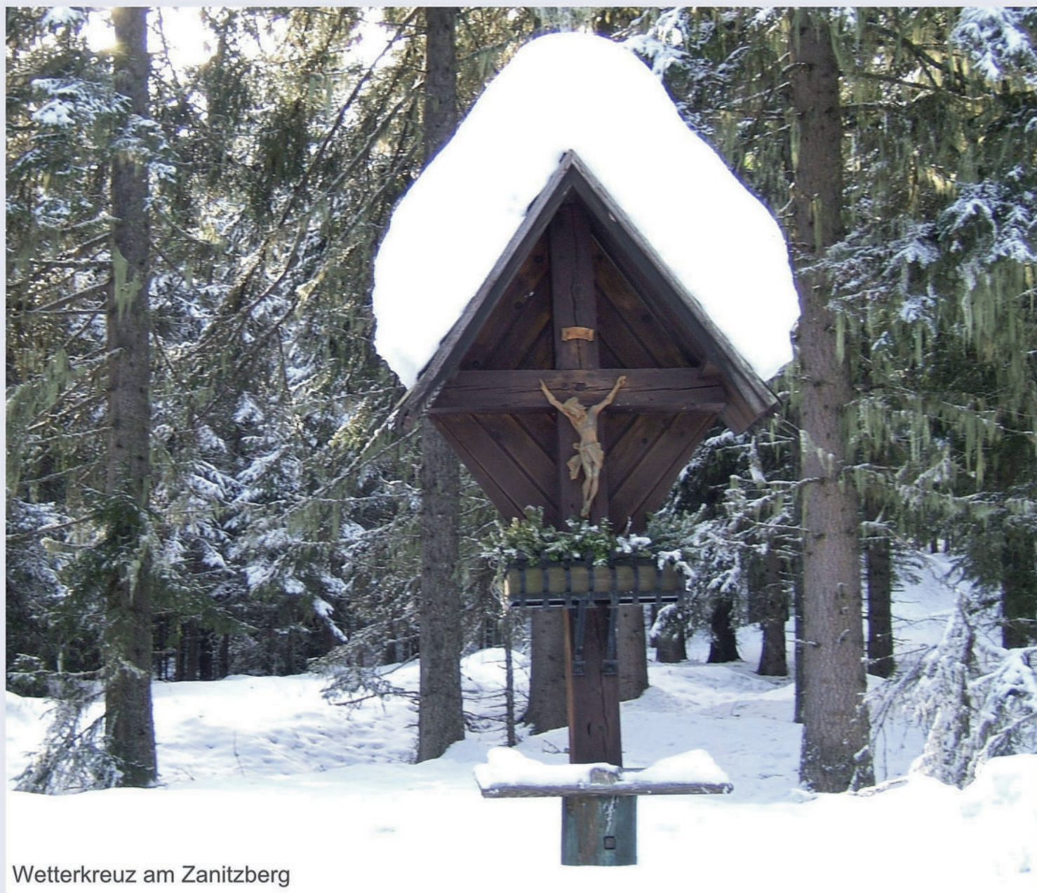
Wetterkreuz am Zanitzberg