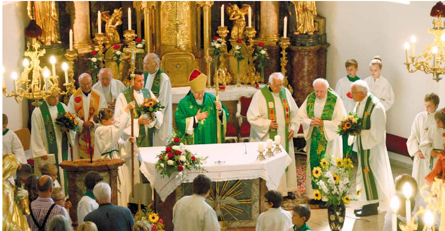
Pfarre St. Stefan

Am Sonntag, dem 17. August findet unser schon zur Tradition gewordenes Pfarr- und Priesterjubiläumfest statt.