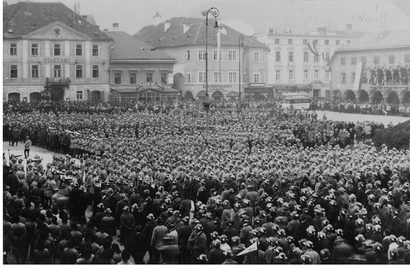
Bruck a. d. Mur