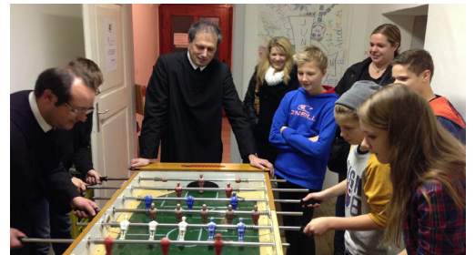
Gebet und Spiel bei der Jugendvesper in St. Lambrecht