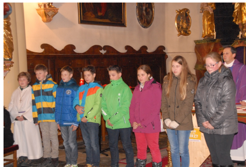
Firmgruppen in Neumarkt beim Vorstellungsgottesdienst am 20. 12.