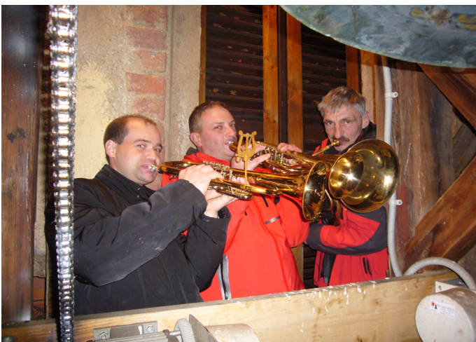
Weihnachtliche Tradition: Turmblasen

Auf dem Weg zur Christmette konnte man die weihnachtlichen Melodien der „Turmbläser“ hören.