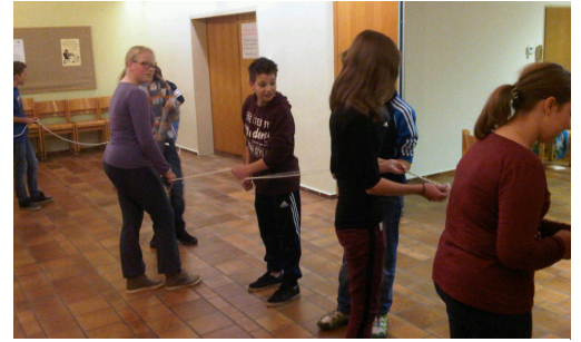
Firmstunde „Gemeinsam unterwegs“