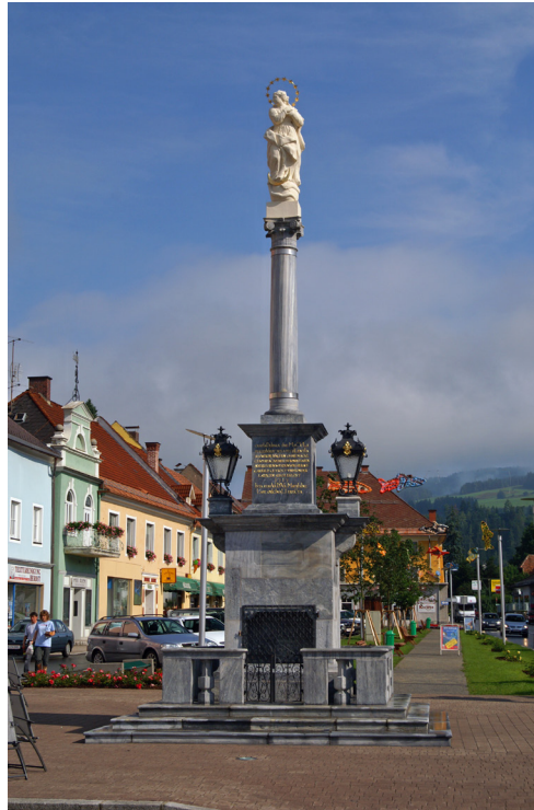
Mariensäule am Hauptplatz

Mit dem linken Fuß steht sie auf der Mondsichel. Der Mond ist das Symbol der Finsternis, der Nacht. Maria bringt Licht in die Welt (die Madonnenfigur steht auf der Erdkugel).