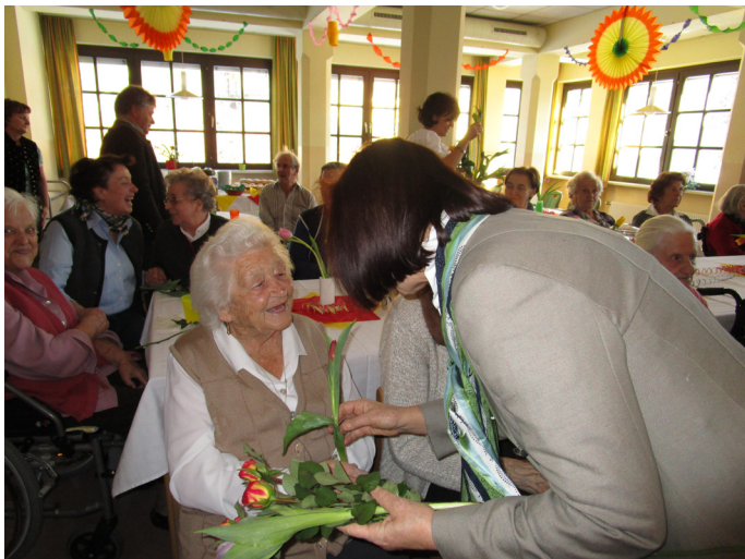
Bunter Nachmittag mit der Chorgemeinschaft Liederkrans