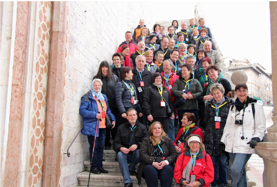
Auf der Treppe bei der Basilika San Francesco in Assisi

Am nächsten Tag treffen wir die örtliche Stadtführerin und vollziehen auf dem Weg durch das malerische Städtchen die Wandlung des großen Heiligen vom verwöhnten reichen Händlersohn und Soldaten zum Prediger von Liebe und Armut. In der Kirche der Heiligen Chiara, die nur ein paar Schritte vom Quartier entfernt ist und von deren Vorplatz man einen wunderschönen Blick über Santa Maria degli Angeli hat, können wir das berühmte San Damiano Kreuz bewundern, von dem her Christus zu Franz von Assisi gesprochen hat. Bei der Basilika San Francesco entsteht auch das erste Gruppenfoto vor der Besichtigung von Oberkirche und Unterkirche mit den teilweise vom Erdbeben Ende der 90er-Jahre gezeichneten Fresken und des Grabes von Franziskus.