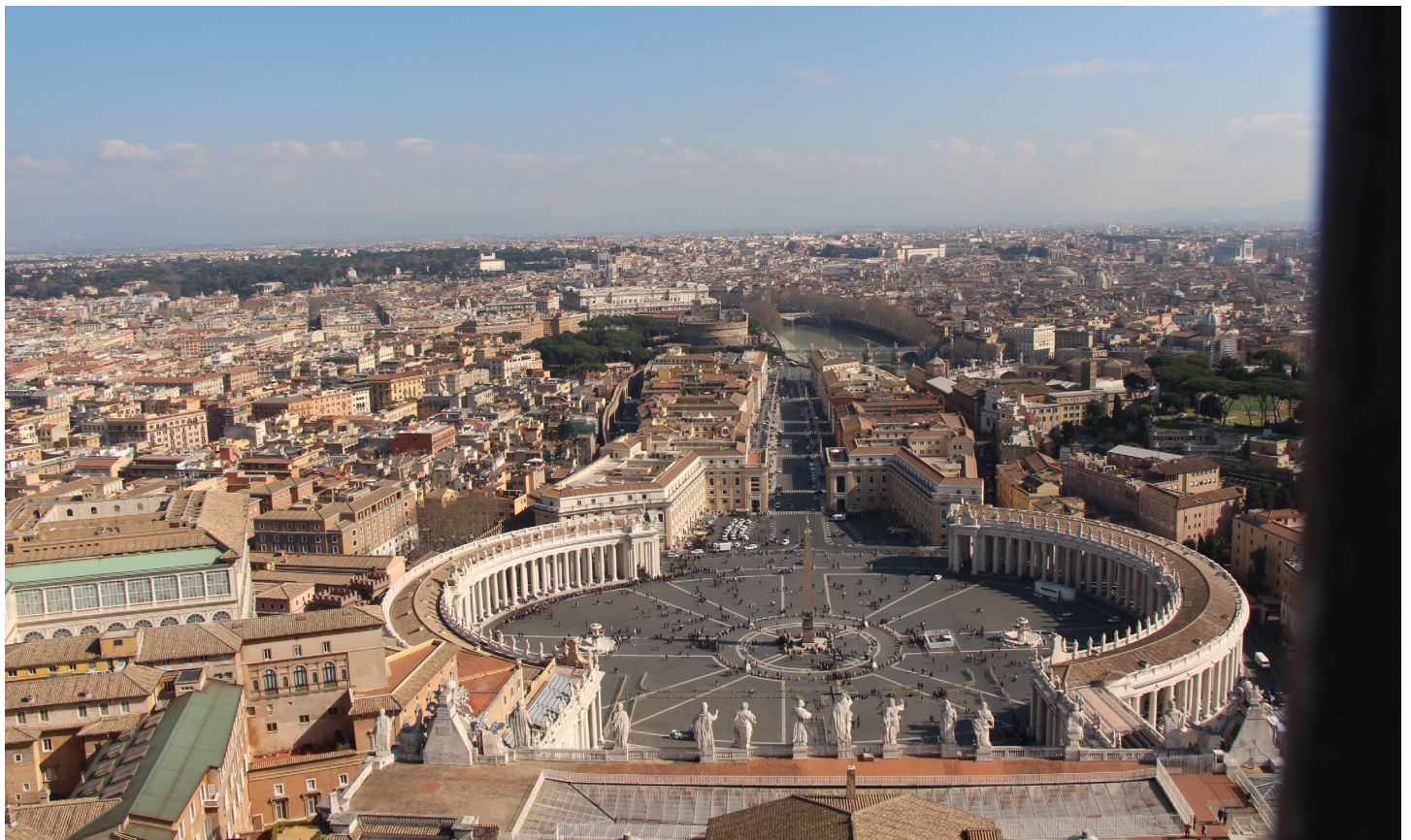
Der Blick von der Kuppel des Petersdoms auf den Platz und die Stadt.

Aber schnell ist die Zeit um und nach Zwischenstopps in Ascoli Piceno, einem mittelalterlichen Städtchen mit Jugendstilcafe und in Ravenna, wo wir die berühmten Mosaik besichtigen, stehen wir am Abend des Samstags schon wieder am Hauptplatz. Voll von Wissen, schönen Eindrücken und geistlichen Impulsen.