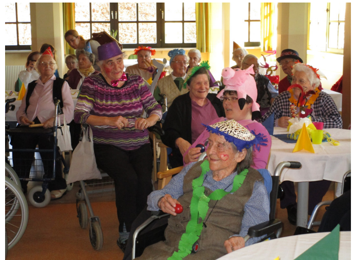
Faschingsfeier im SPWH St. Katharina