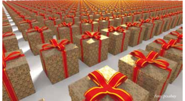
Nicht alle Geschenke sind „wert-voll“.