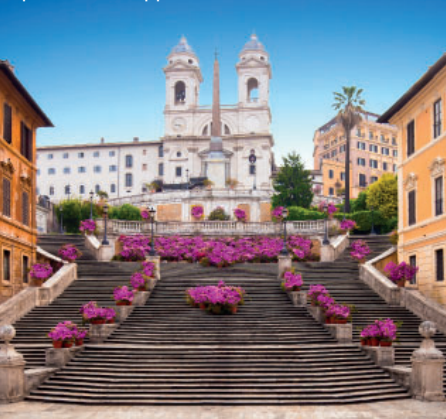
Spanische Treppe, Rom

Am Vormittag Teilnahme an der Papstaudienz (Anwesenheit des Papstes vorausgesetzt). Am