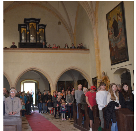
Emmausgang nach St. Stefan