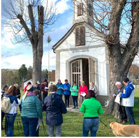
Kreuzweg zur Taucherkapelle