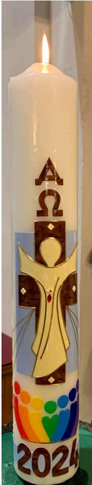
Gestaltet von Magret Goger – Danke dafür