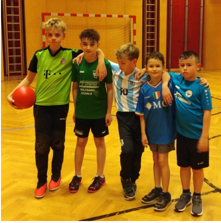
Fußballspiel der Minis