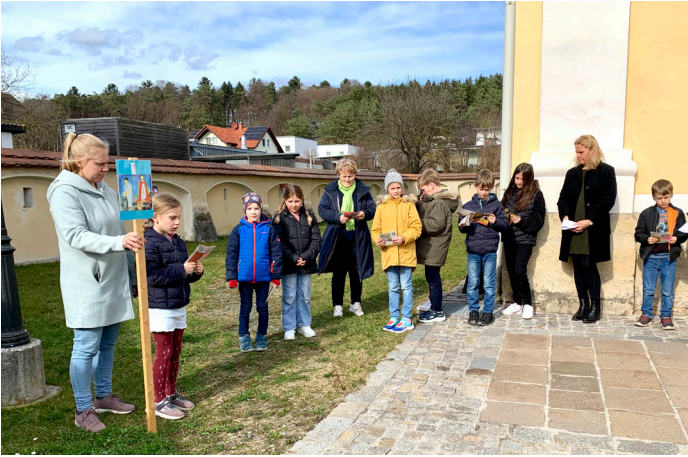
Kreuzweg der Erstkommunionkinder