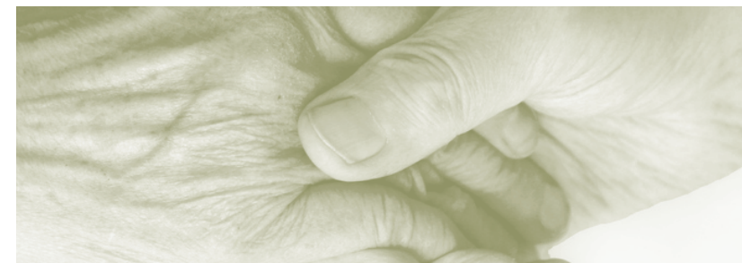
Layout & Satz: Franz Pietro/DigiCorner, Graz 2020

Du gehörst dazu. Ich höre dir zu. Ich rede gut über dich. Ich gehe ein Stück mit dir. Ich teile mit dir. Ich besuche dich. Ich bete für dich.