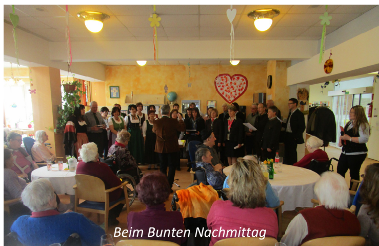
Beim Bunten Nachmittag