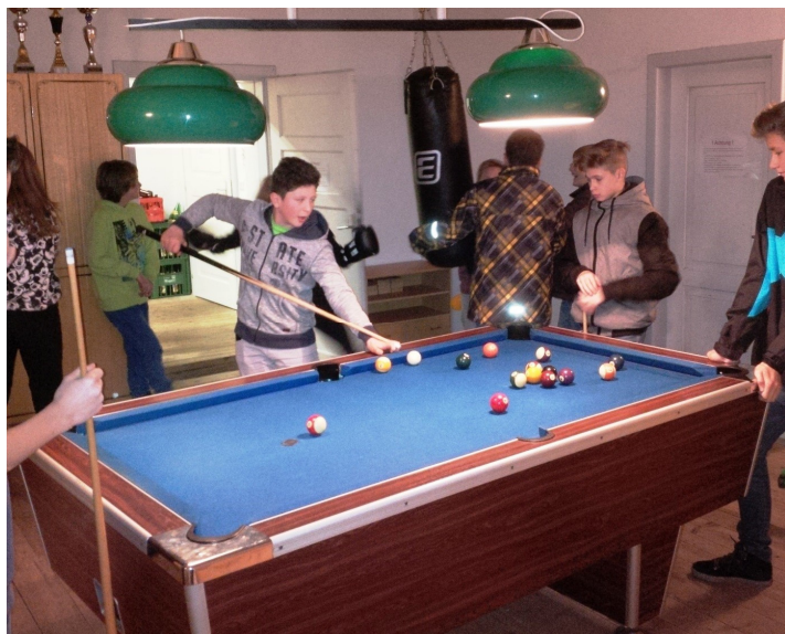
Firmkandidaten nach der Jugendvesper im Jugendzentrum JUX

Seit November 2015 läuft die Firmvorbereitung in unserem Pfarrverband. 21 junge Menschen bereiten sich für den Empfang des Sakramentes der Firmung vor: in Projekten, Firmstunden und Gottesdiensten. Zu einem Gottesdienst laden wir besonders ein: den Taferneuerungsgottesdienst am 17. April 2016, 10:30 Uhr in der Pfarrkirche Greith. Es sei hier schon ein Dank an die Eltern und