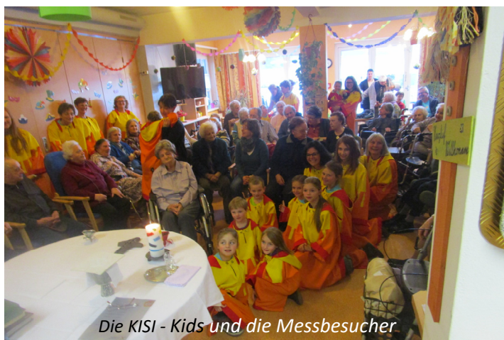
Die KISI - Kids und die Messbesucher