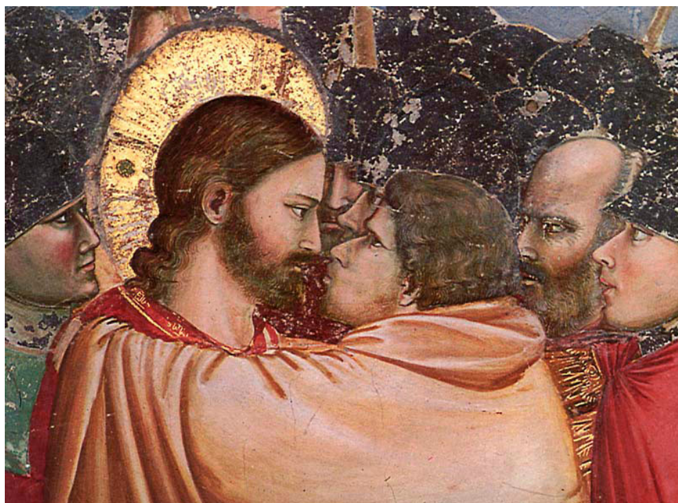
Giotto di Bondone: Gefangennahme Jesu (Ausschnitt) Capella Scrovegni in Padua

Ein besonderes Bild ist der Verrat. „Der Judaskuss, der Christus verrät und dessen Passion einläutet, ist eine Szene voller Dramatik, die in den Blicken der Akteure zum Ausdruck kommt. Am intensivsten - von bis dahin unbekannter, selbst bis heute nur selten erreichter Ausdruckskraft - ist dabei der Augenkontakt zwischen Christus und Judas, in dem die volle Spannung zwischen Verdammnis und Erlösung liegt, der sich Enrico Scrovegni ausgesetzt sah. Jesus blickt dem Menschen, der ihn verrät, in die Augen. Es ist ein Blick der Liebe. Und - das ist das überraschende: Der Verräter blickt Jesus in die Augen, in Boshaftigkeit und Verstocktheit, zugleich voll Verzweiflung und Durst nach Barmherzigkeit. Er kann sich den Frieden nicht selber schenken. Es ist die Bitte um Barmherzigkeit der Familie Scrovegni. Es kann auch unsere Bitte um Barmherzigkeit sein.