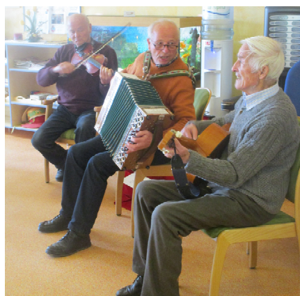
Die Grabner Buam spiel'n auf

Zu unserer großen Freude kommen auch immer wieder neue Freiwillige hinzu. Anfang des Jahres besuchten uns die Grabner Buam aus St. Veit und umrahmten unsere erste Geburtstagsfeier mit Gesang und Geschichten aus der Umgebung.