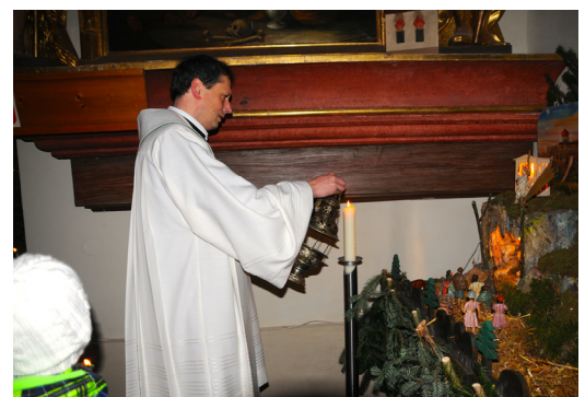
Berichte: Aurelia Köck